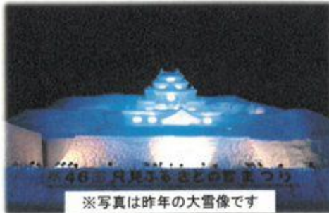
※写真は昨年の大雪像です